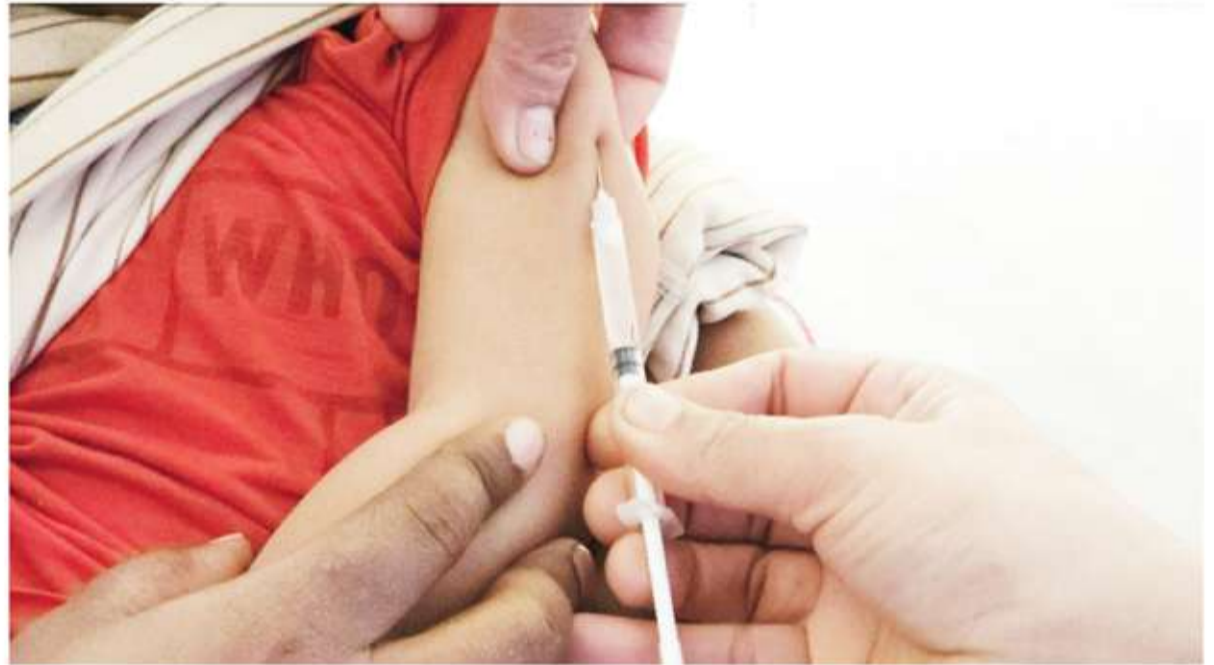
Grave. En Argentina, apenas la mitad de los chicos tiene el esquema completo de vacunación al ingresar a la escuela.

Según el análisis difundido por la SAP, uno de cada tres niños no recibió el refuerzo de la vacuna quintuple a los 15 meses, mientras que apenas la mitad de los chicos de 5 años tenía el esquema completo al momento de ingresar a la escuela en 2024. En el caso de las personas gestantes, la cobertura de vacunas clave como la dTpa y la del Virus Sincicial Respiratorio también se ubicó por debajo de lo recomenda-