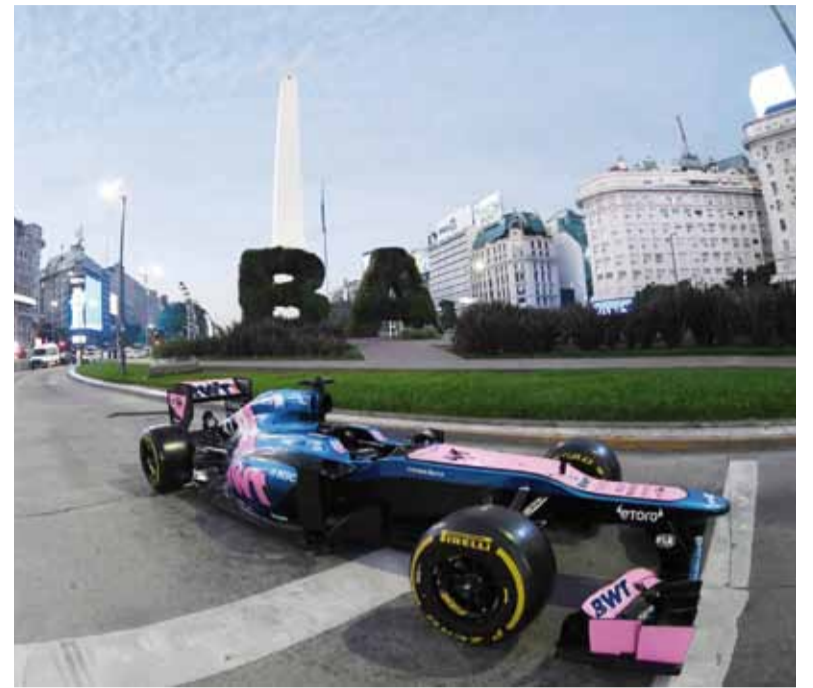
Enciende motor. El monoplaza fue exhibido en el Obelisco.

del Parque 3 de Febrero. Desde el miércoles comenzaron los cierres progresivos de avenidas clave como Iraola, Sarmiento y tramos de Libertador, que hoy, entre las 7 y las 18, alcanzará el mayor nivel de afectación, con clausuras totales en sectores estratégicos del corredor vial y sus accesos.