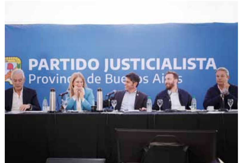
Interna. Kicillof asumió en el PJ bonaerense y Máximo Kirchner encabezó en paralelo un acto en Santa Fe.

La cuestión de la alimentación es urgente: el 90% del presupuesto de Desarrollo de la Comunidad se