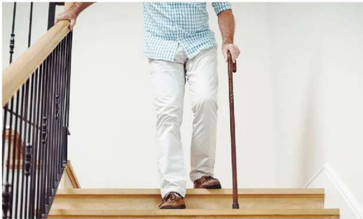
Zona de riesgo. Se debe tener especial precaución con las escaleras en los hogares donde viven adultos mayores.

Estos infortunios representan la principal causa de lesiones y pérdida de autonomía en personas mayores de 65 años. La muerte de Luis Brandoni a causa de un accidente doméstico volvió a poner el tema en agenda.