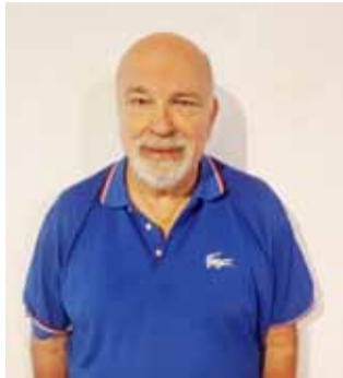
Escribe: Ing. Gustavo Huesca Pérez.