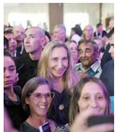
Objetivo. La secretaria general de la Presidencia dijo que el plan es ganar la provincia de Buenos Aires.

La presidente de LLA subrayó además el valor político del encuentro en el interior bonaerense y sostuvo que la construcción en la Provincia no puede pensarse desde un escritorio, sino con presencia, organización y trabajo en cada distrito. -DIB-