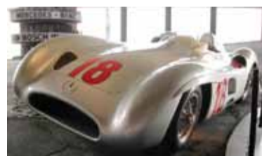
El W196 Roadster del "Chueco".

En ese marco, se realizará un recorrido especial por el trazado urbano delimitado en las calles palermitanas a bordo de una réplica del Mercedes-Benz W196 Roadster, el histórico monoplaza con el que Fangio conquistó los títulos mundiales de 1954 y 1955, marcando una era en la máxima categoría. La recreación del vehículo busca respetar al máximo el diseño original que llevó a la gloria al piloto de Balcarce, con una reproducción fiel de su estética, dimensiones y espíritu competitivo. Sin embargo, presenta una diferencia sustancial respecto