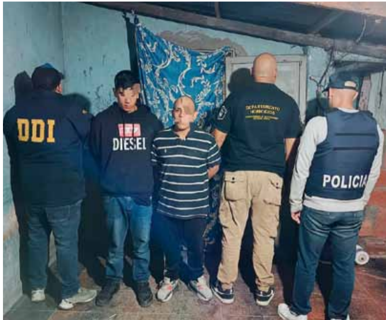
Capturados. La policía detuvo a dos sospechosos y hay otras dos personas prófugas.

La pesquisa permitió establecer que la banda estaba integrada por al menos cuatro delincuentes armados que actuaban de manera coordinada. Incluso, minutos antes del homicidio, habían sustraído una Renault Kangoo que habría sido utilizada como vehículo de apoyo