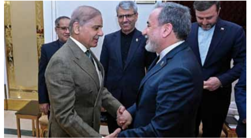
Mediación. El canciller iraní se reunió con el primer ministro de Pakistán quien busca reactivar el diálogo en las próximas horas.

pital paquistaní con destino a Mascate, en Omán, tras mantener una intensa agenda de reuniones con autoridades locales, sin esperar la llegada de la delegación estadounidense.