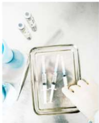
Investigación. Hay más de 900 vacunas en desarrollo en este momento en el mundo.

do. Estas cifras están lejos del 95% necesario para garantizar la inmunidad colectiva, es decir, la protección indirecta de toda la comunidad.