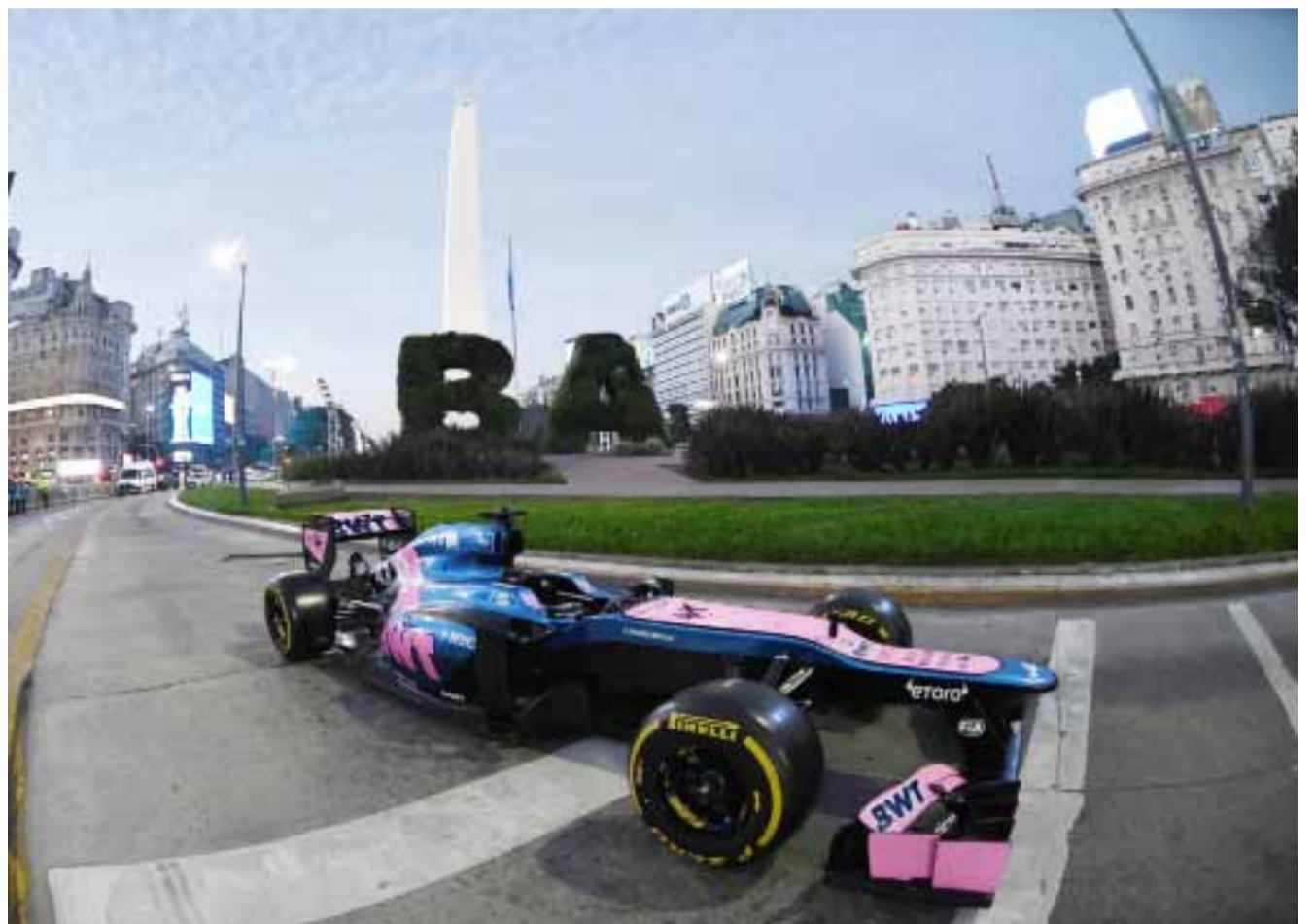
Presentaron ayer, en el Obelisco, el auto que conducirá hoy en Buenos Aires.