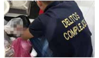
La Justicia investiga una presunta red de trata de personas.

Ocho fetos humanos fueron encontrados en bolsas de residuos en la Clínica Santa María, situada en la localidad bonaerense de Villa Ballester, donde se halló internada a una niña de 12 años que cursaba un embarazo de ocho meses y la Justicia investiga una presunta red dedicada a la trata de personas o sustracción de menores.