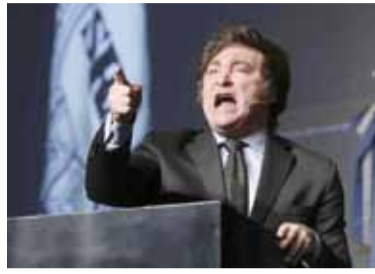
El Presidente criticó al canal TN.

Milei apuntó otra vez a periodistas: "Basuras inmundas"