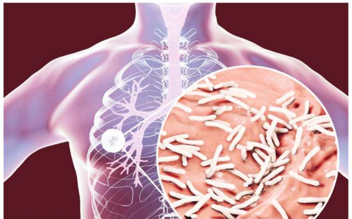
Infección. La tuberculosis es causada por el bacilo de Koch.

El Programa Municipal de Control de Tuberculosis que intervino en el caso funciona en articulación con las instituciones sanitarias estatales de la ciudad, entre ellas la Región Sanitaria VIII, el Hospital Interzonal, el Hospital Materno Infantil, el Instituto Nacional de Epidemiología, los Centros de Atención Primaria de la Salud y el Centro de Especialidades Médicas Ambulatorias (CEMA) de Mar del Plata.